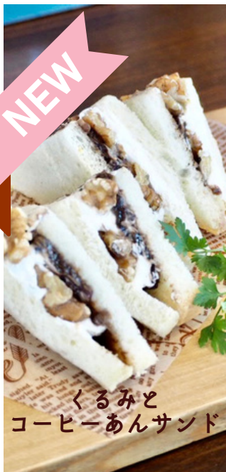
くるみと コーヒーあんサンド