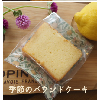
季節のパウンドケーキ