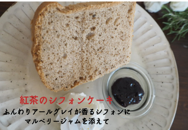
紅茶のシフォンケーキ